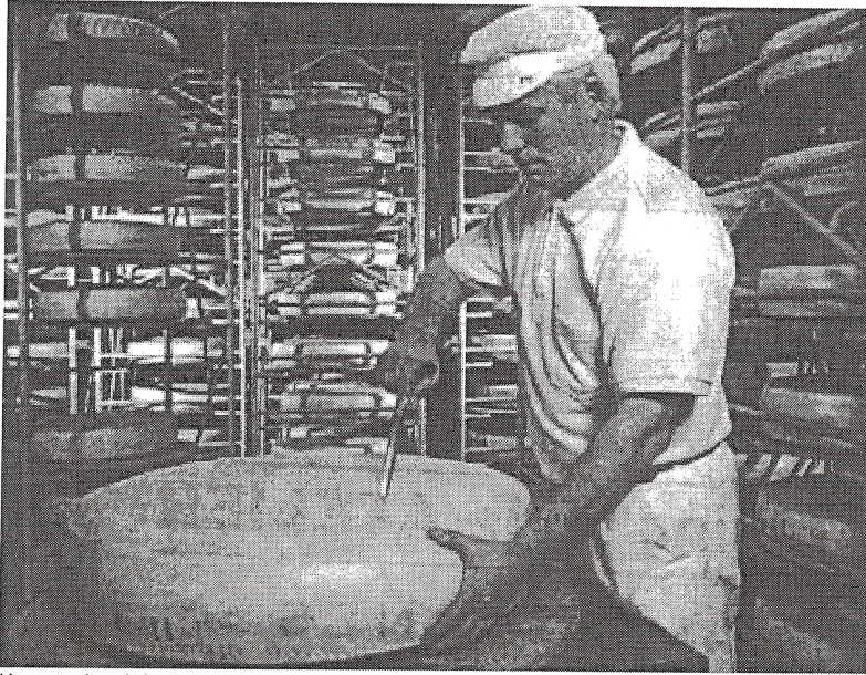
Käse weltweit beliebt. Dingolfinger Anzeiger ... Datum

Wie schwer ist dieser KäselaiB, wenn 1 \text{ dm}^3 Käse 1,5 \text{ kg} wiegen? Begründe dein Ergebnis.